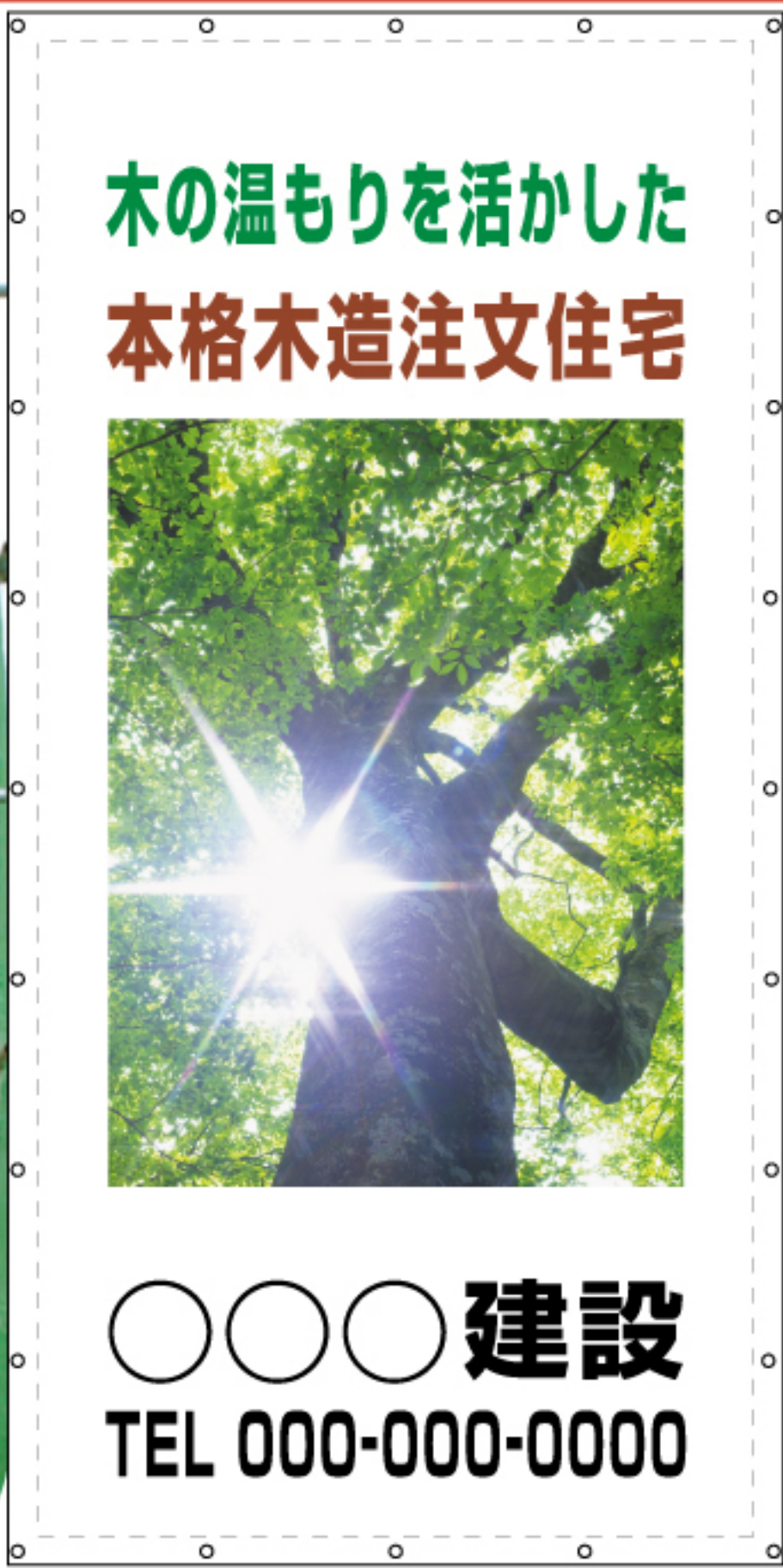
商品番号 FP-9 (vol.5掲載)